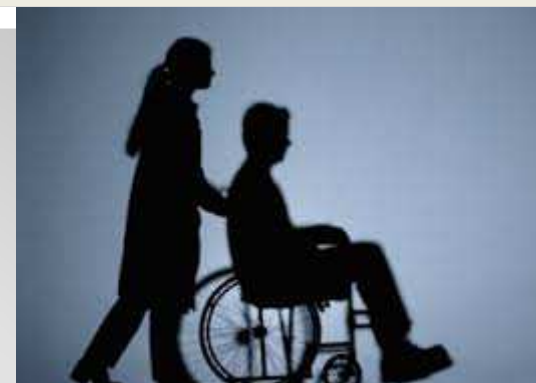
Figura professionale prevista al secondo comma dell'articolo 42 del DPR 617/77 (Assistenza ai minorati psicofisici) e nell'articolo 13, comma 3 della Legge 104/92 (Obbligo per gli enti locali di fornire assistenza per l'autonomia e la comunicazione personale agli alunni con handicap fisici e sensoriali).